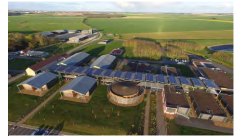
Lycée agricole de Chartres