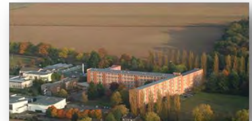
Lycée agricole d'Amboise