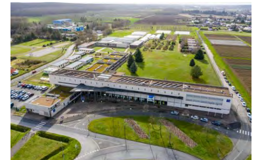
Lycée du végétal de Beaune la Rolande