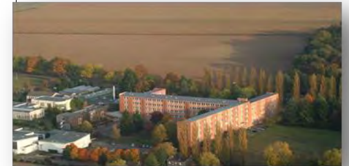
Lycée professionnel horticole de Blois