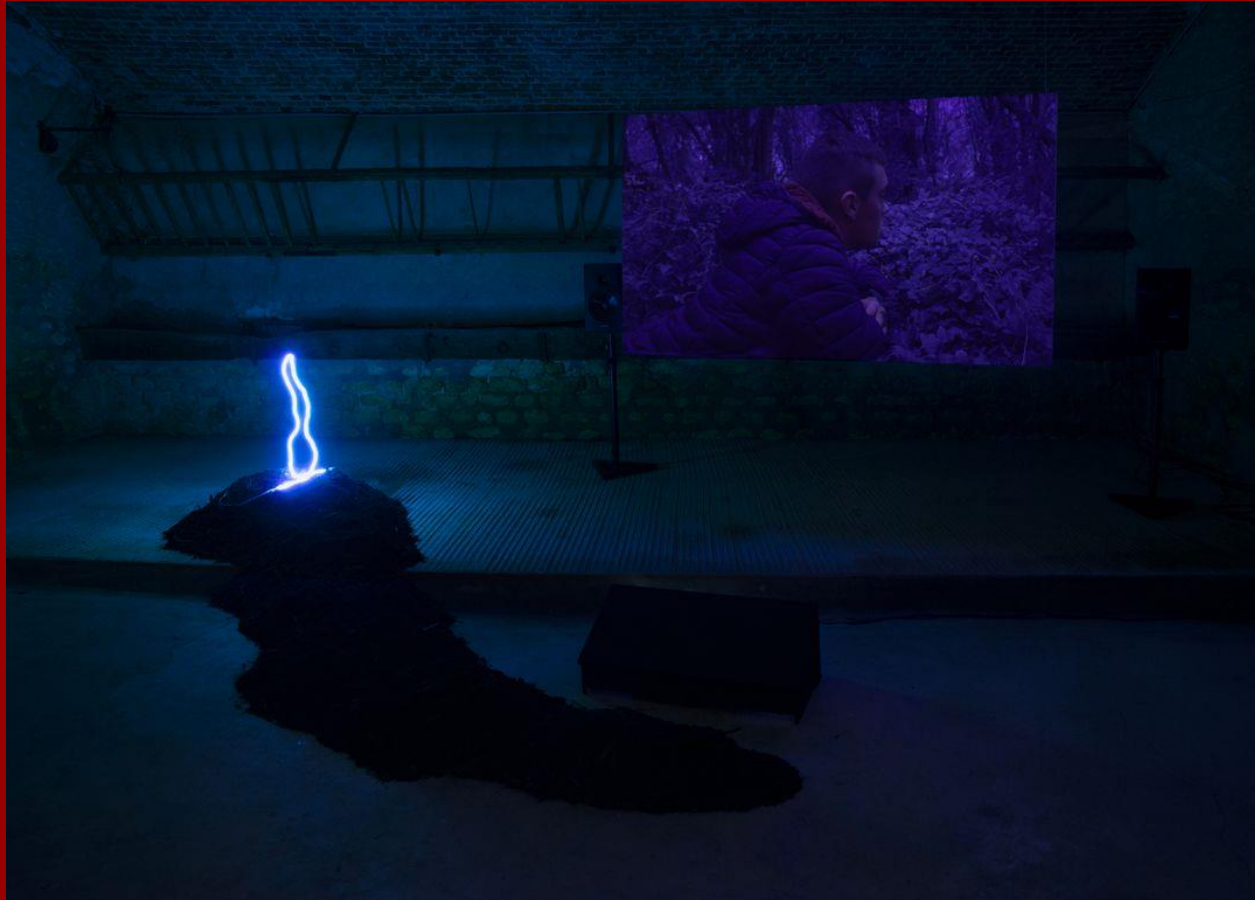
© Nicolas Lefebvre et Camille Zisswiler « Candela » Résidence d'artiste 2022-23 au lycée agricole de Chartres (28)